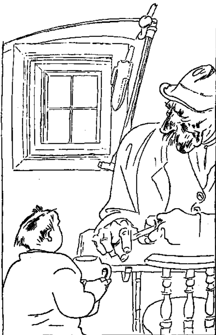
Thoma mit dem Wilderer