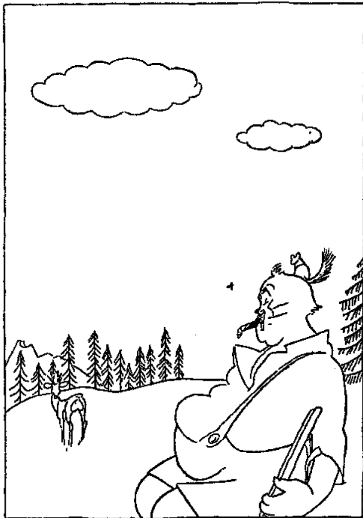
Auf der Jagd

Charakteristisch für ihn war die Art, wie er sich an dem Wettbewerbe beteiligte. Er hatte das Ausschreiben übersehen