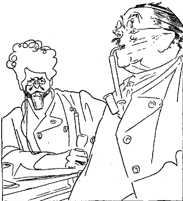
Thoma und Ganghofer