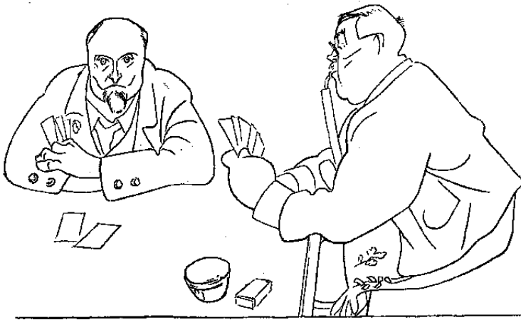
Thoma beim Tarock

Das war wirklich wie Heimkehr in die alte, so lang entbehrte Welt.